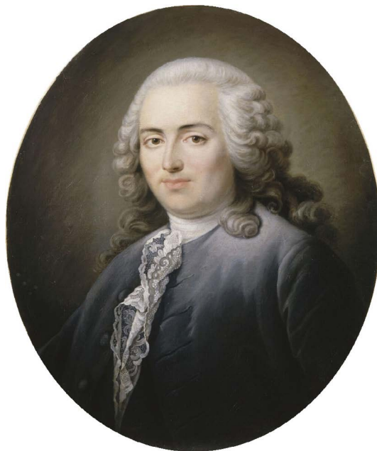
Anne Robert Jacques TURGOT, Contrôleur des Finances de Louis XVI

Prix du meilleur livre d'économie financière