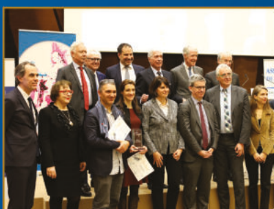
33 ème Prix Turgot