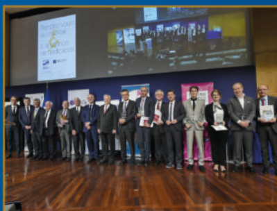
31 ème Prix Turgot