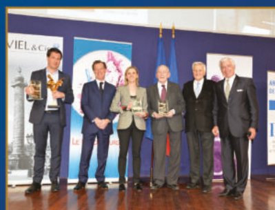
32 ème Prix Turgot