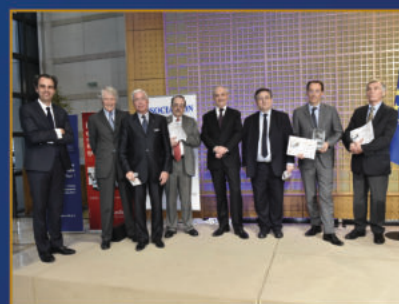
29 ème Prix Turgot