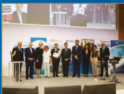
34 ème Prix Turgot