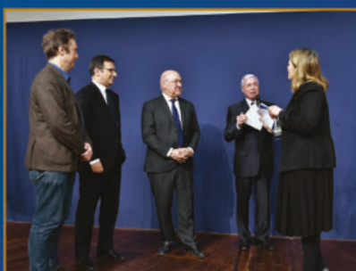
30 ème Prix Turgot