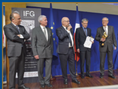
28 ème Prix Turgot