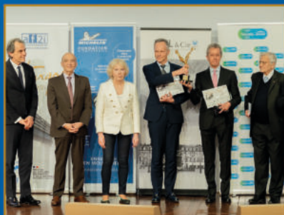
36 ème Prix Turgot