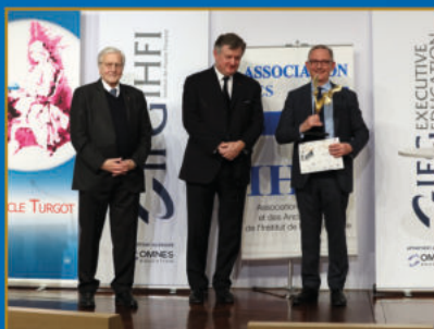
37 ème Prix Turgot