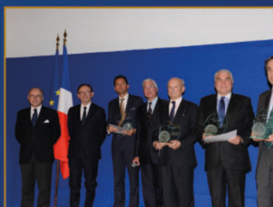
27 ème Prix Turgot